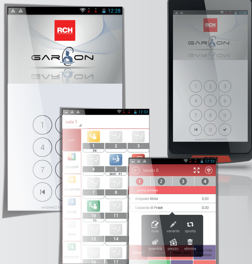
• Panoramica tavoli